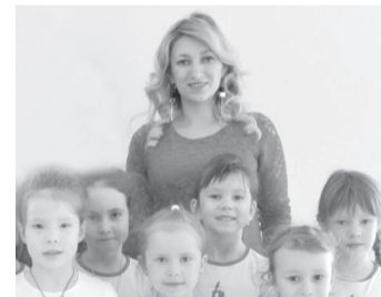
12 марта состоялись предварительные переговоры по вопросу реализации проекта. Спортивный клуб «Премиум-спорт» выступает одним из потенциальных арендаторов данного объекта.