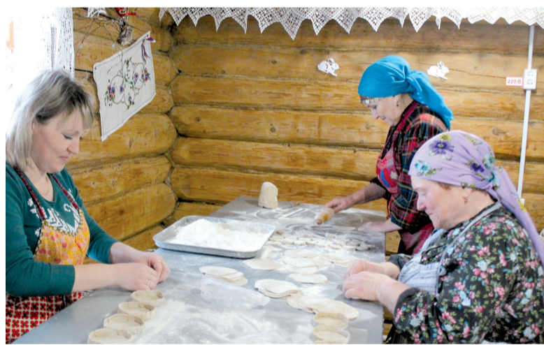
Сотрудники музея-заповедника «Лудорвай» готовят сочни по фирменному рецепту.