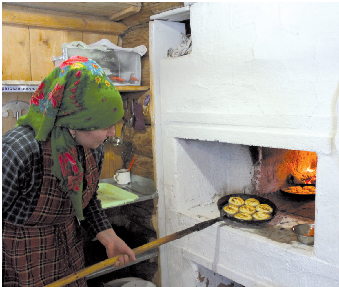
Горячие перепечи с пылу с жару.

Сама печка тоже является хранительницей от сглаза. «Есть такое поверье, — продолжает