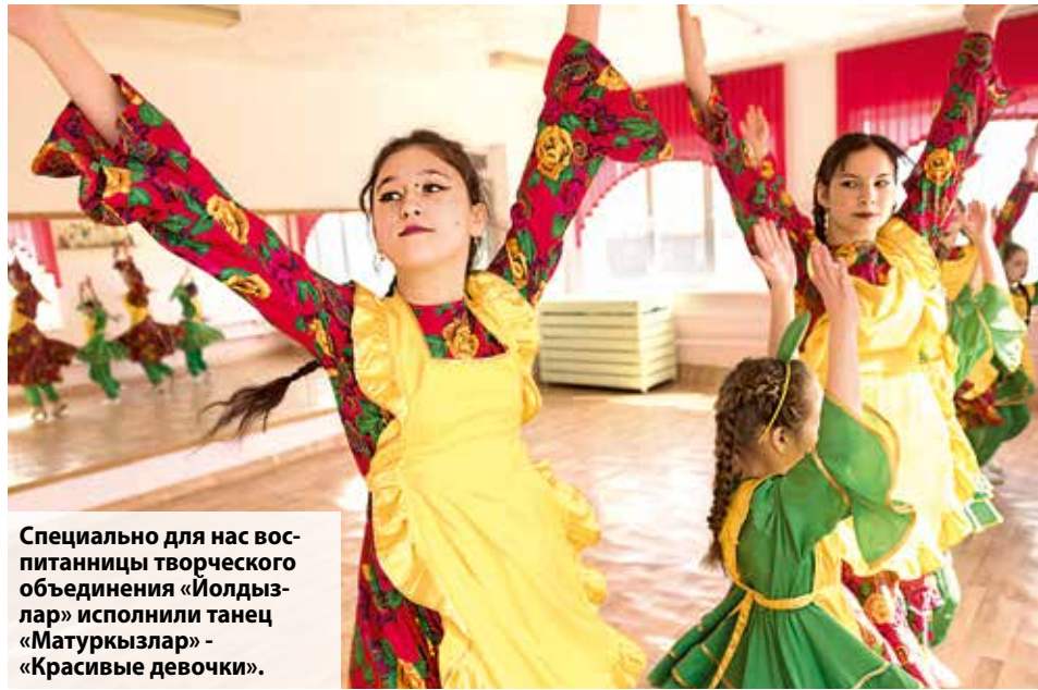
Специально для нас воспитанницы творческого объединения «Йолдызлар» исполнили танец «Матуркызлар» - «Красивые девочки».