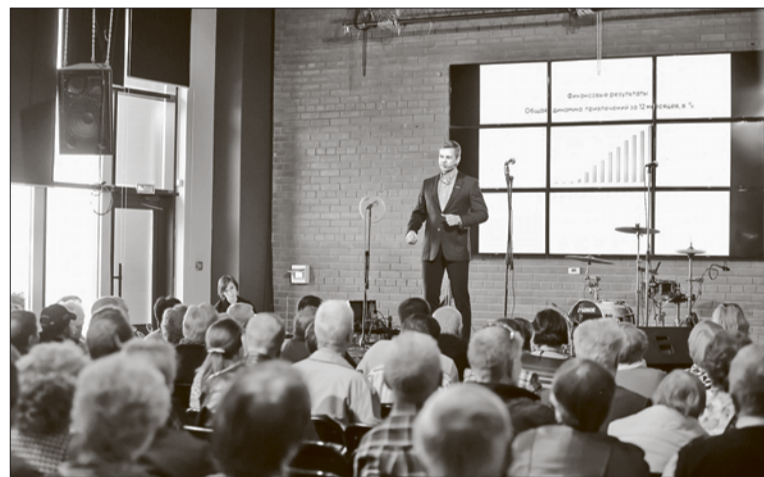
Программы сбережений для физических лиц:*

Собрание пройдёт во Дворце культуры Свердловского района. Повестка встречи уже составлена, а «СангиленАгро» готовит для пайщиков не только отчёты, но и ярмарку продуктов, произведённых флагманами финансового клуба и другими его членами.