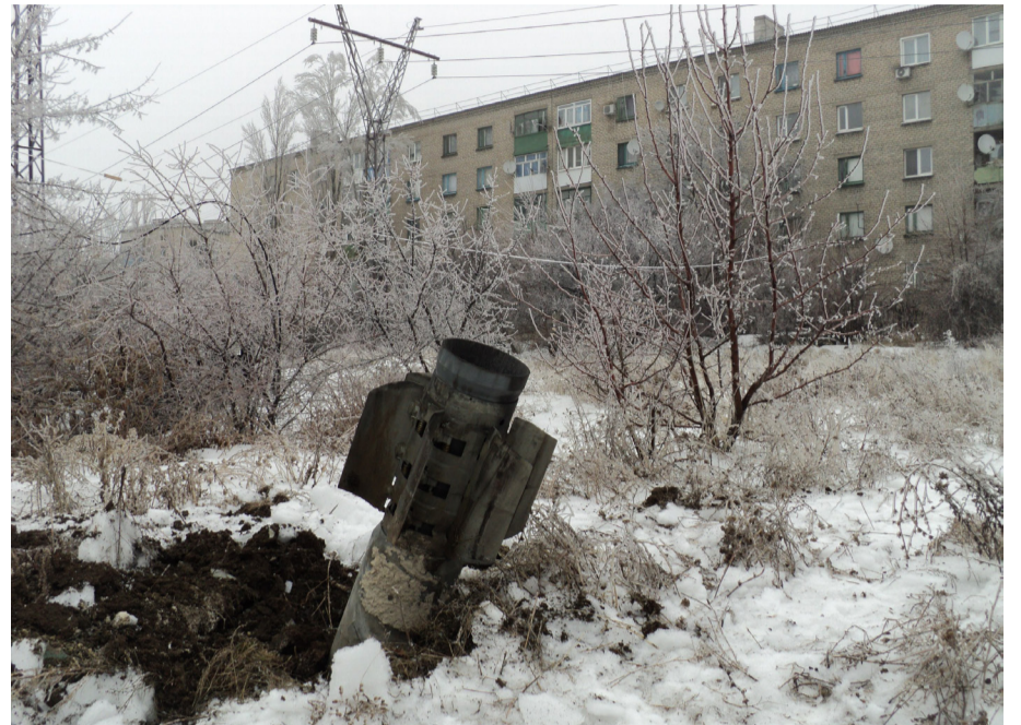
● Снаряд «Урагана» упал в 30 метрах от жилого дома

Конечно, не все люди относятся с пониманием к твоей ситуации. Многие недобровольны призрачными привилегиями,