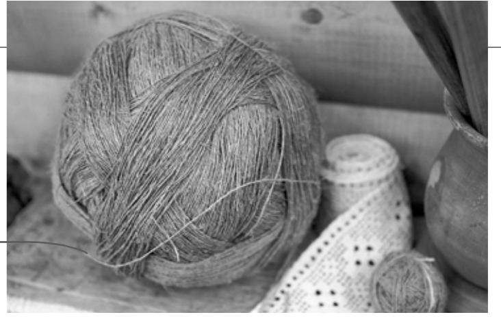
От растения конопля до такой вот нитки — огромный труд женщины